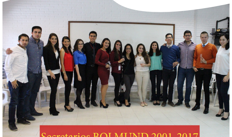
Secretarios BOLMUND 2001-2017