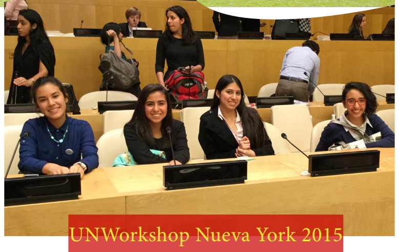
UNWorkshop Nueva York 2015