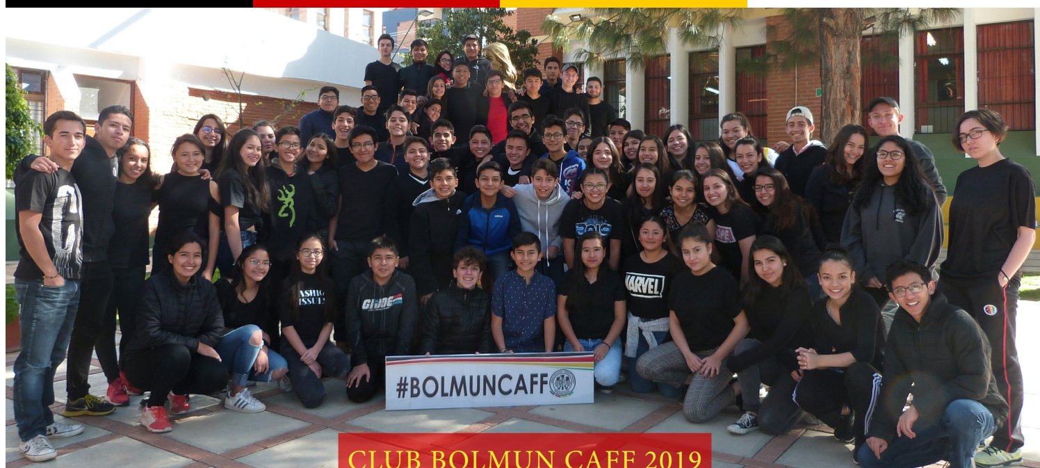
CLUB BOLMUN CAFF 2019