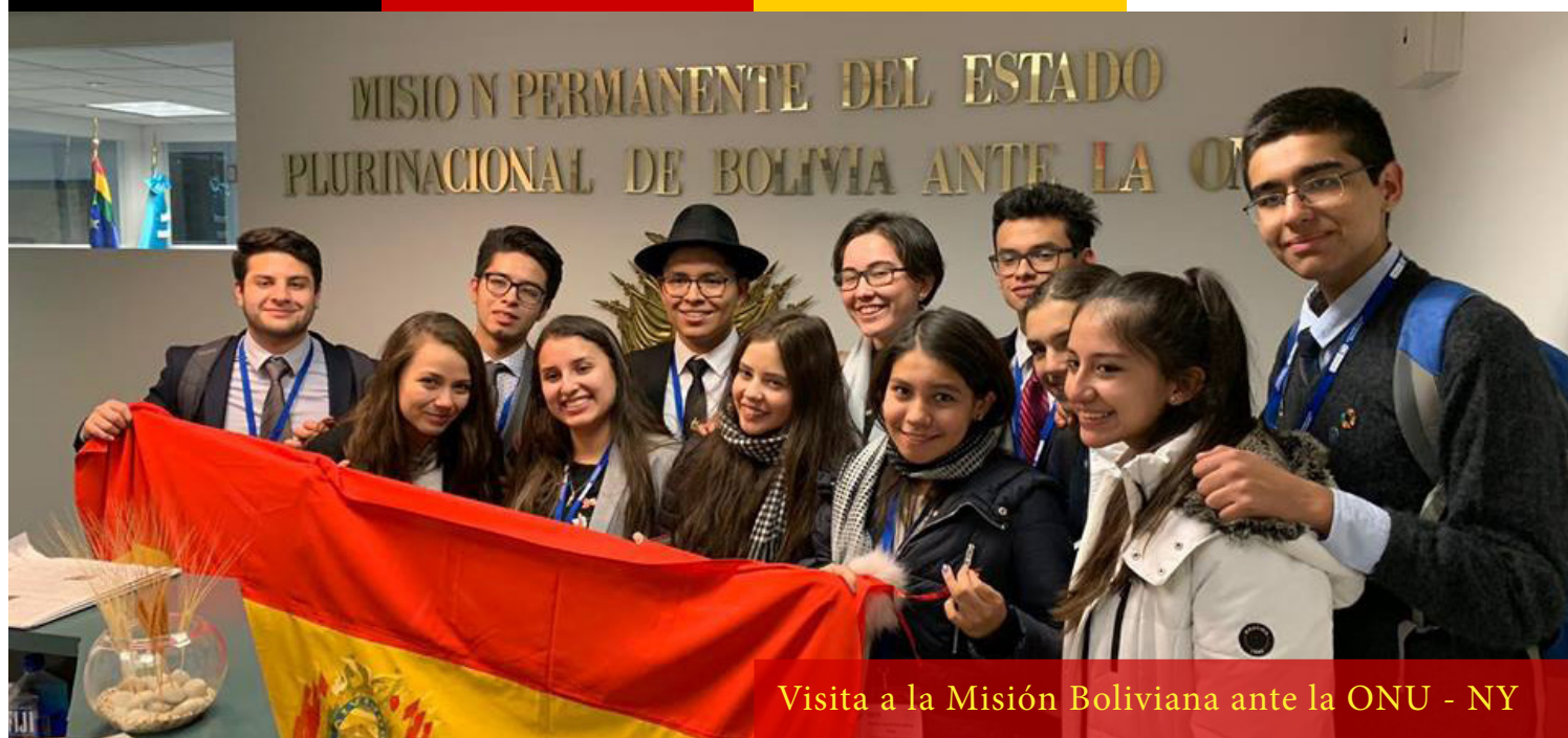
Visita a la Misión Boliviana ante la ONU - NY